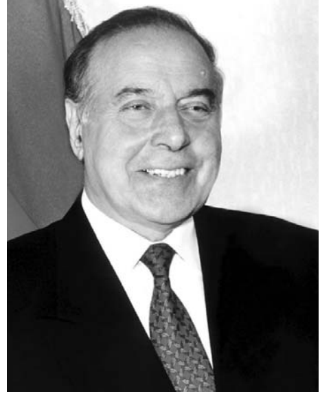
Azərbaycan dünyaya günəş kimi doğacaq. Heydər ƏLİYEV