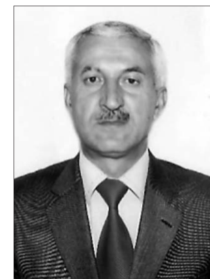
Deyərlər, nağıl dili yüyrək olur. Sənin ömrün nə tez ötüb keçdi, dayımın əziz oğlu, el-obanın sevimlisi!

Ha çalışıram fikrimi yayındırım, sənin nurlu siman gəlir gözlerimin önünə. Təkcə mənimmi? Yox, bu tezlikdə gedirəm ağrıtdı bizi. Hələ 55-ci yaşına təzəcə qədəm qoymuşdun. Sənin parlaq arzuların qabaqdaydı. Bir qız, bir oğul sənin toy xeyir-duanı görmüşdü. İki övladın da evləndirməyə macal tapmamışdı. Dörd nəvən qol-qanadların idi. Onları görməyə dərixirdin, xatırlayıb gülümsəyirdin. Doğrudanmı nəvə bu qədr şirin olur? İndi onları sənin