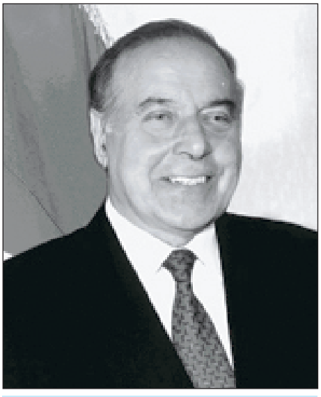
Azərbaycan dünyaya günəş kimi doğacaq. Heydər ƏLİYEV