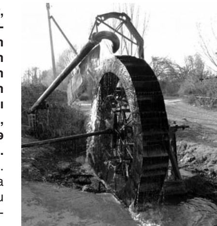
zəhməti hesabına dəyirman 2003-cü ilə kimi işləyib.

Sonralar dəyirman unudulub. Amma 1985-ci ildə yenidən bərpa olunub və hər gün taxıl üyüdülmə bu dəyirməndə. Hamarat, Daster, Dzdipok və Bradillər dəyirmanının gecəgündüz işləməsi sayəsində yn sardan korluq çəkməyiblər. Beləcə, Allahın suyu və torpağı kəndlinin də