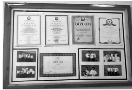
“Cəsurlar” komandasının üzvlərinə verilmiş Fəxri fərmanlar