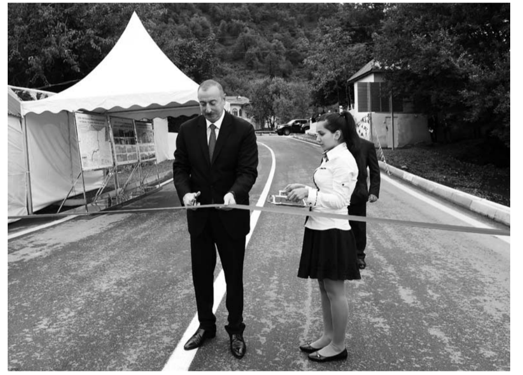
aidir və ikizolaqlıdır. Yolun inşası zamanı müxtəlif diametrlə suötürücü borular tikilib, iki körpü keçidi inşa olunub. Bu yolun tikilməsi bölgədə sərnişin və yük daşınmasını xeyli yaxşılaşdırmağa imkan verəcək. Həmçinin sözügedən avtomobil yolunun tikintisi yerli və xarici turistlərin ərazidə yerləşən istirahət mərkəzləri və yerli tarixi mədəniyyət abidələri ilə də tanış olmalarına şərait yaradacaq. Prezident İlham Əliyev yeni yolun rəmzi açılışını bildirən lenti kəsdi. Sonda xatirə şəkli çəkildi.