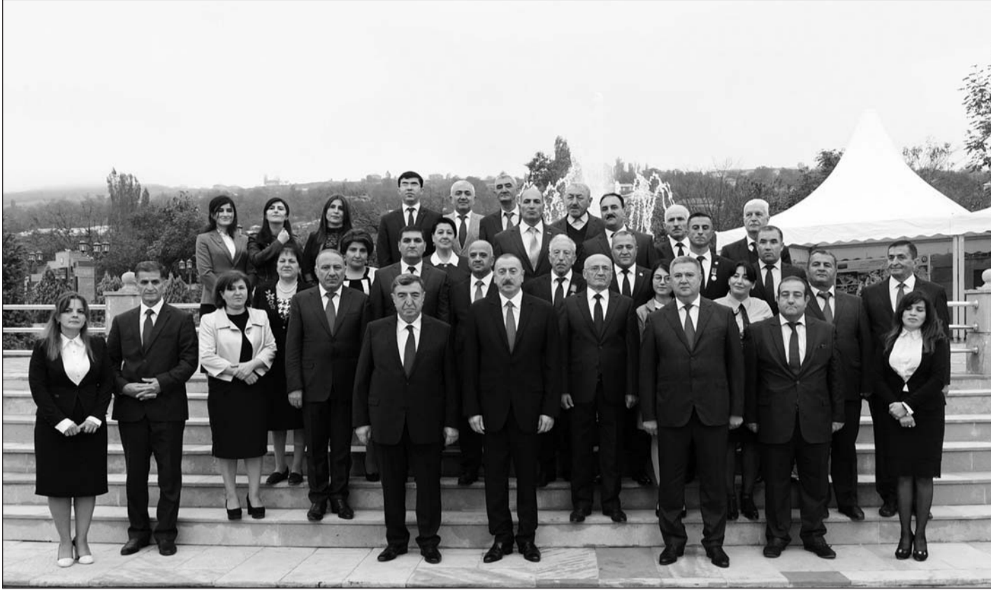
Əvvəlki səh. 1-də

Azərbaycanda aparılan dövlət siyasətinin mərkəzində vətəndaşların sosial məsələlərinin həlli dayanır