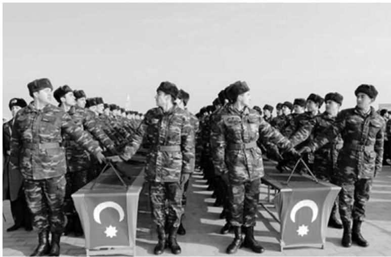
Torpaqlarımızın bir hissəsinin düşmənlə işğalı altında olması, eyni zamanda, ölkəmizin yerləşdiyi tarixi, siyasi, coğrafi mövqeyi daim bizdən daha yük-

sək hərbi-vətənpərvərlik ehal-ruhiyyəyə da olmağımızı tələb edir. Bir çox ölkədə orduda xidmət etmək gəncin vətəndaşlıq borcudur. Ancaq Azərbaycan övladının borcu başqa ölkələrin gənclərinə nisbətən bir neçə qat artıqdır. Çünki torpaqlarımız düşmənlə işğal edilmişdir, ölkəmizin ərazi bütövlüyünə təhdid olub, xalqımızın min illər boyu yaratdığı və zənginləşirdiyi dəyərlər talan edilmişdir. Xəyanətkarlığın, vandalizmin nəticələrini aradan qaldırmaq, ərazi bütövlüyümüzü bərpa etmək gənc vətənpərvərlərin, cəsur və qorxmaz əsgərlərin öhdəsinə düşür. Bu baxımdan gənclər arasında hərbi xidmətə hörmət və diqqət daim diqqət mərkəzində saxlanılır, hər bir gəncin orduda xidmətə gətirməsi onun ailəsində əlamətdar hadisəyə çevrilir. Həmşə olduğu kimi 2018-ci ilin