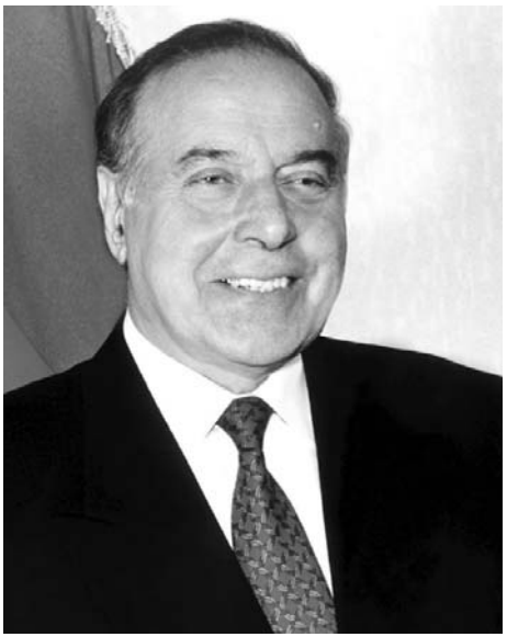
Azərbaycan dünyaya günəş kimi doğacaq. Heydər ƏLİYEV