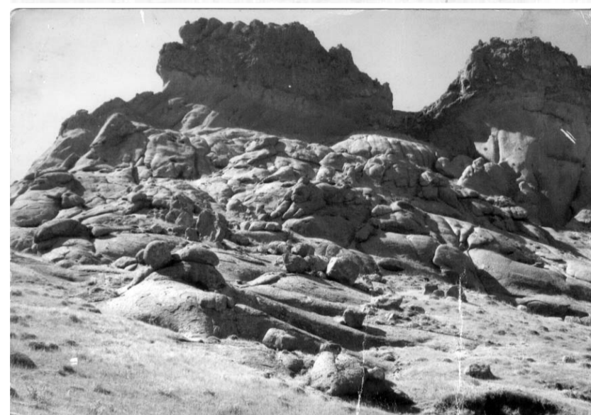
Oğlan Qalası, nəyin qaldı sirr qalası?!