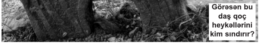
Görəsən bu daş qoç heykəllərini kim sındırı?