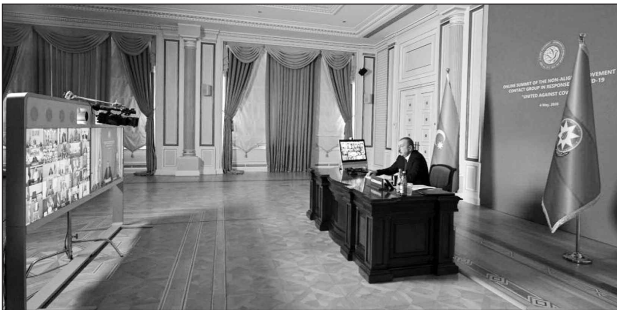
Dünyada COVID-19 pandemiyasının başlanmasından etibarən Prezident İlham Əliyevin rəhbərliyi altında Azərbaycan Respublikası tərəfindən regional və global səviyyədə koronavirusa qarşı mübarizədə beynəlxalq həmrəyliyin gücləndirilməsi məqsədilə zəruri təşəbbüslər irəli sürülmüş və əməli addımlar atılır.

Pandemiya insanların həyatını təhlükə altına qoyan ciddi sağlamlıq problemləri yaratmaqla bərabər mənfi fəsadları hələ uzun müddət hiss olunacaq sarsıdıcı global sosial-iqtisadi və humanitar təhlükələr yaratmışdır. Dünya müharibəsi ilə müqayisə olunan COVID-19 pandemiyası şəraitində özünü təcrid və fransentuar xarakter daşıyan tədbirlər əvəzinə global həmrəyliyi və global baxışa böyük ehtiyac vardır.