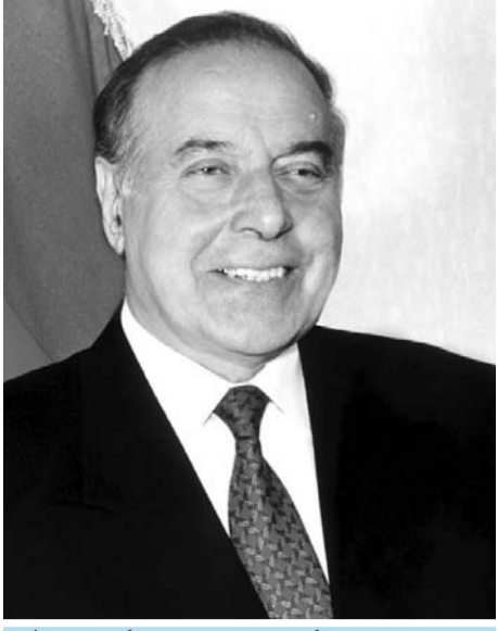
Azərbaycan dünyaya günəş kimi doğacaq. Heydər ƏLİYEV