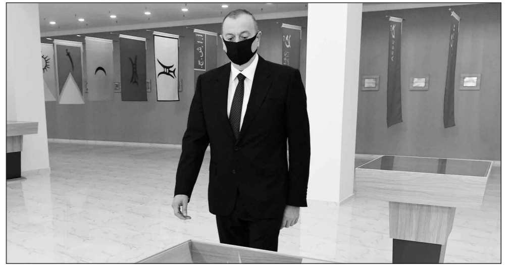
Prezident cənab İlham Əliyevin 03 iyun 2020-ci il tarixində Tərtər və Ağcabədi rayonlarında həyata keçirdiyi açılış zamanı maskadan istifadə etməsi hər bir Azərbaycan vətəndaşı üçün nümunə olmalıdır.

Nazirlər Kabineti yanında Operativ Qərargahın tələb və tövsiyəsi ilə həftə sonlarında vətəndaşların çölə çıxmasının qadağan olunması, fəaliyyətinə icazə verilmiş ticarət müəssisələri, obyektlerin, apteklərin belə 2 gün ərzində bağlanması haqqında qərarın qəbul edilməsi insanların sağlamlığını qorumaq məqsədini daşıyır.