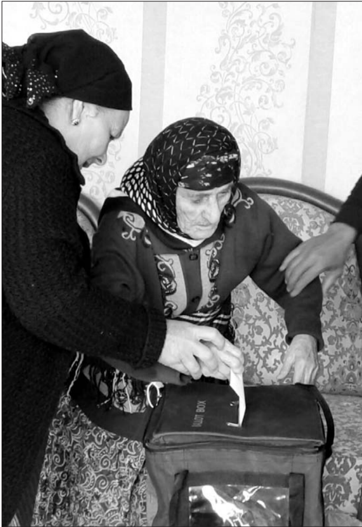
(Əvvəlki səh. 1-də)

van yaşaması üçün həyarta keçirdiyi tədbirlər, göstərdiyi diqqət və qayğı həmişə minnətdarlıqla qarşılanır. Rayonda, eləcə də Lerikdə tikinti-quruculuq işləri sürətlənir. Biz hamılıqla inkişafımıza dəstək olan real namizədə səs verdi seçimdə yanılmamışıq.