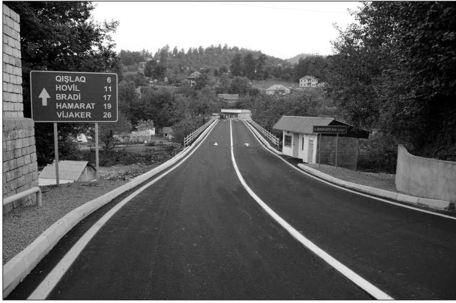
(əvvəlki səh. 3-də)

Bütün bunların qarşısını almaqdan ötrü cənab Prezident tərəfindən 30 sentyabr 2015-ci il tarixdə Azərbaycan Respublikası Cinayət Məcəlləsində dəyişikliklər edilməsi haqqında qanun imzalanmışdır. Qanuna əsasən mükiyyəti istifadə və ya icarə hüququ olmadan torpaq sahəsini özbaşına hasarlaşdırma, becərmə və