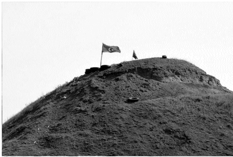
Azərbaycan bölgənin ən güclü ordusuna sahibdir

Müdrüklər deyirlər ki, hər bir xalqın, dövlətin böyüklüyü, qüdrəti onun müharibə aparmaq bacarığı və silah-sursatının çox olması ilə deyil, onun qədim mədəniyyətə, tarixə, sülhsevərliklə malik olması ilə ölçülür. Tarixin qovğalarından keçmiş Azərbaycan sözün həqiqi mənasında qədim tarixi keçmiş, maddi-mədəniyyət abidələri, dahi şəxsiyyətləri daim sülh tərəfdarı olması ilə böyükdür.