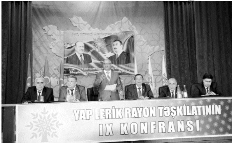
YAP LERİK RAYON TƏŞKİLATININ IX KONFRANSI

Yeni Azərbaycan Partiyasının sədri, Prezident cənab İlham Əliyevin rəhbərliyi ilə Azərbaycan son