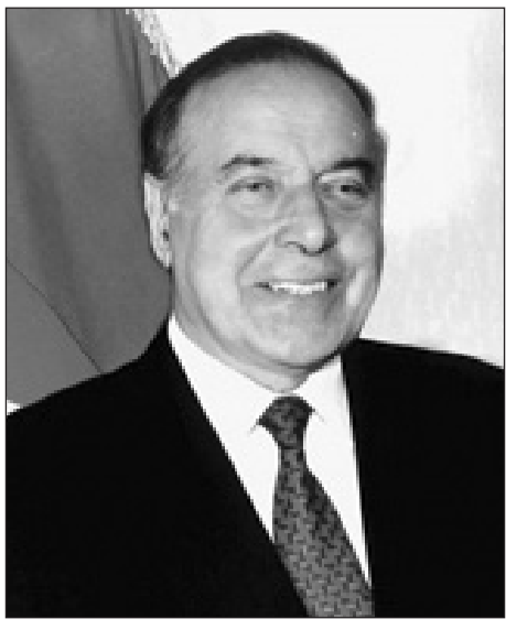
Azərbaycan dünyaya günəş kimi doğacaq. Heydər ƏLİYEV