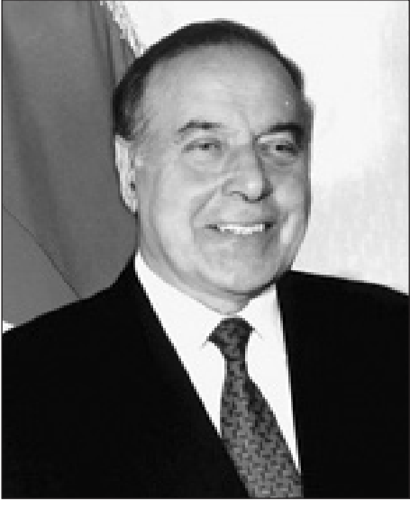
Azərbaycan dünyaya günəş kimi doğacaq. Heydər ƏLİYEV