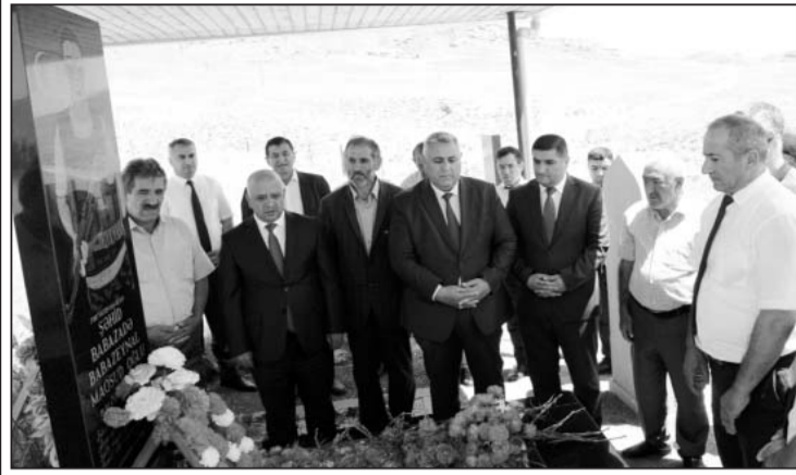
Amburdərə kəndində şəhid Babazeynal Babazadənin doğum günü münasibətilə rayon icra hakimiyyəti başçısının səlahiyyətlərini icra edən Cəlif Baxşiyev və birinci vitse-prezident Mehriban xanım Əliyevaya minnətdarlıqlarını bildirdilər.

yətlərini icra edən Cəlif Baxşiyev rayonun hüquq-mühafizə orqanlarının rəhbərləri və kənd sakinləri ilə birlikdə şəhidin mezarını ziyarət etdi və üzərinə gül-çiçək düzdülər.